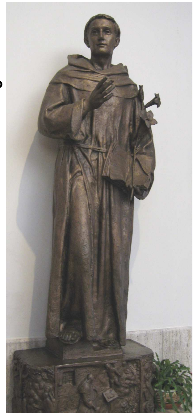
Romano Vio - Chiesa di Mira Porte - S. ANTONIO

Benedici i nostri figli, proteggi i giovani. Soccorri quanti sono provati dalla malattia, dalla sofferenza e dalla solitudine. Sostienici nelle fatiche d'ogni giorno, donandoci il tuo amore. Per Cristo nostro Signore. Amen.